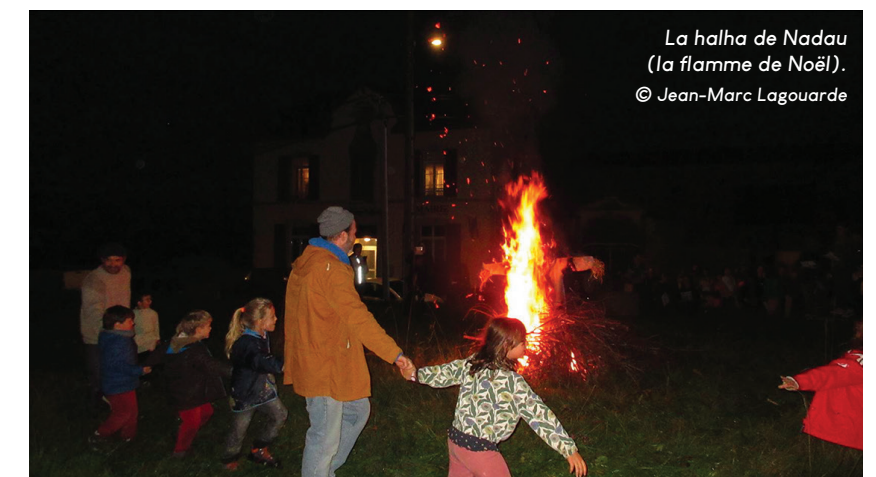
La halha de Nadau (la flamme de Noël).

À Cultura de Noste, nous maintenons cette tradition du chant et nous préparons une animation, pour le samedi 20 décembre, à l'église d'Ozenx, à 17 h 30, suivie d'un moment de convivialité, à la salle de fêtes.