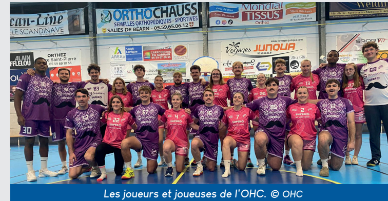
Les joueurs et joueuses de l'OHC.

Nos jeunes sportives et sportifs ne cessent de démontrer leur implication dans les bonnes causes nationales, notamment celles qui concernent la santé. Les filles et les garçons de l'OHC, très attachés aux valeurs de partage et de solidarité, ont activement participé à Octobre Rose et à Movember. Ils arboraient, sur les terrains de hand, des maillots aux couleurs adaptées à ces deux événements.