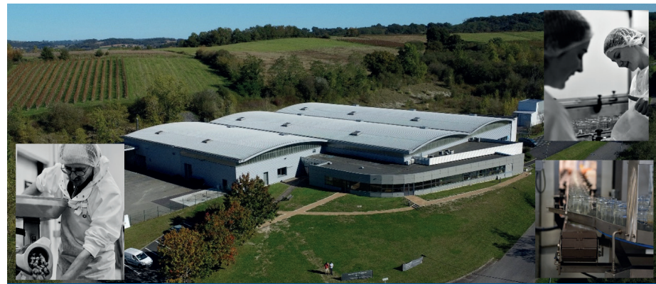
La Maison Argaud: le savoir-faire et la qualité.

Maison Argaud: 1 chemin de l'Espérance à Bellocq; 05 59 65 13 51 maisonargaud.com; contact@maisonargaud.com