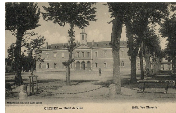
L'hôtel de Ville d'Orthez.

1840 : il est décidé la construction d'une nouvelle mairie (un 1 er plan avait été établi dès 1834) pour réunir tous les services municipaux, en partie sur l'emplacement même des fondations du couvent et de l'ancien rempart est du Vieil Orthez, mais tournée vers l'extérieur de l'urbain médiéval. Henry d'Arnaudat en sera l'architecte. Le bâtiment est d'une architecture simple par sa stricte symétrie, sobre et peut-être un peu froide, imposante car il faut y réunir toute l'administration municipale (53 m de long sur 16,25 m de large et 16 m de hauteur). Son style Empire l'oblige à mar-