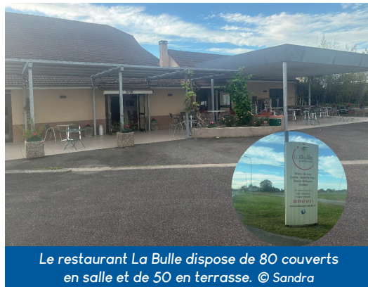
Le restaurant La Bulle dispose de 80 couverts en salle et de 50 en terrasse.

contact@labulle-argagnon.com ; www.restaurant-labulle.fr