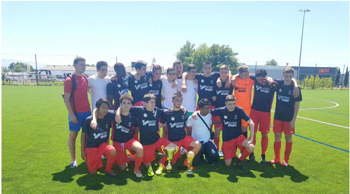
U 17 football