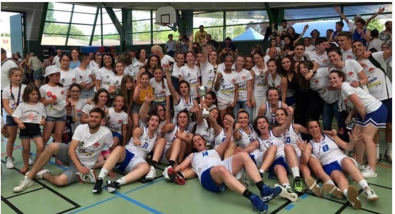
Séniors filles basket