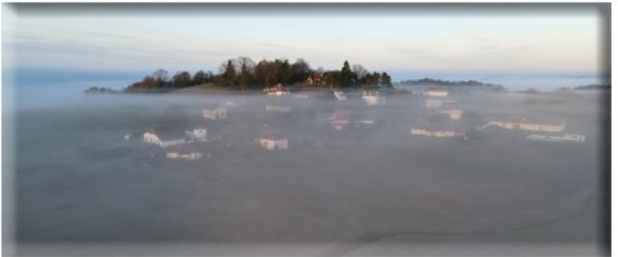
Quartier Cauhapé dans la brume du matin