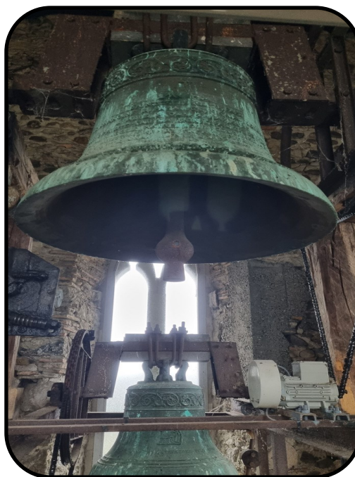
La cloche de 1790 et, plus petite, celle de 1964

Le 17 mai, la cloche est en place, garantie 1 an.